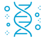
生命科学研究 研究