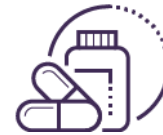
制药 & 生物制药