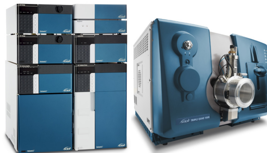
SCIEX ExionLC™液相系统 + Triple Quad™ 4500质谱系统

流动相: A相: 水 (0.2%甲酸) B相: 甲醇 (0.2%甲酸) 流速: 0.4 mL/min 柱温: 40 °C 进样量: 50 µL